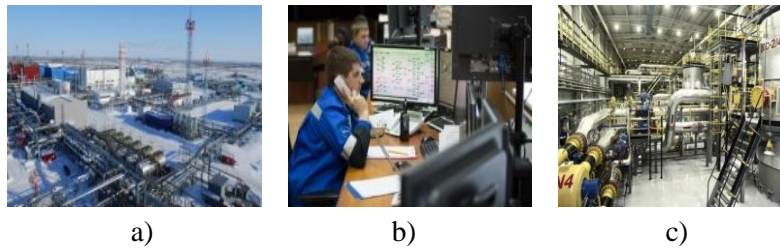
Fig. 1 Workplaces of an oil and gas production operator: a) industrial site, b) operator's room, c) machine hall